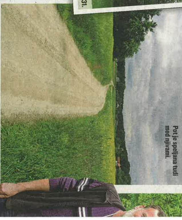
Pot je spejšana tudi med njivami.