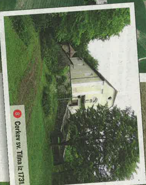
8 Cerkev sv. Tihna iz 1731.