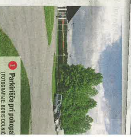
1 Parkirišče pri pokopališču