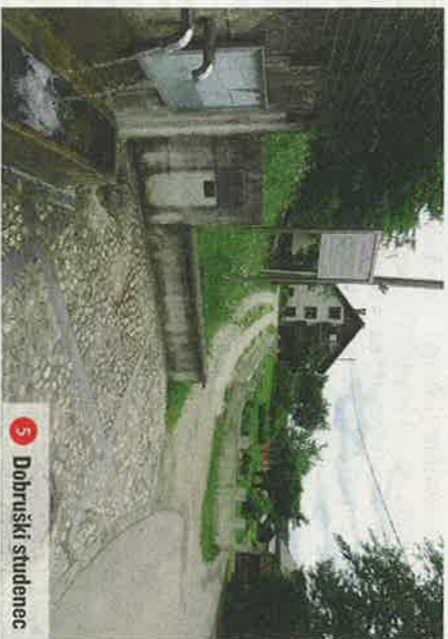
5 Dobruški studenec

Občina Vodice, ki se razprostira na 31 kvadratnih kilometrih, kjer v 16 naseljih živi 4778 prebivalcev, se ponaša z enkratno lego sredi neokrnjene narave. Njena panorama sega na severu mimo brniškega letališča do vršacev Kamniško-Savinjskih Alp, na vzhodu jo obdajajo gozdovi Bukovškega in Koseškega hriba, proti jugu še odpirajo slikovita Ljubljanska vrata med Rašico in Šmarno goro, na zahodu pa se prek avtoceste Ljubljana–Kranj razteza Škofjeloško hribovje, ki se končuje s čudovitimi pogledi na Julijske Alpe.