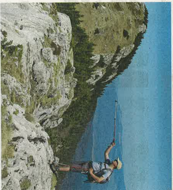
VIŠKOKOGRADJE NAD BIHAĆEM

Raženji ali hribi, to je bosansko vprašanje