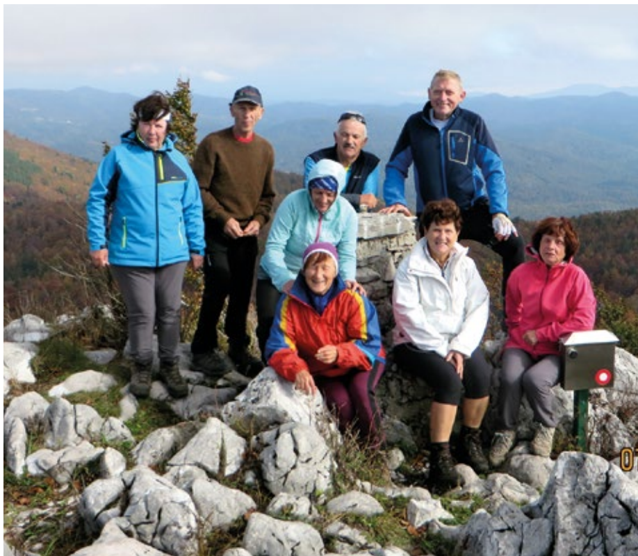
Na vetrovnem vrhu najvišje vzpetine na Nanosu (Suhi vrh 1313 m)

Pred leti smo se že povzpeli na Nanos do Vojkove kočice po zanimivem pristopu iz naselja Strane pri Razdrtem. Letos smo izbrali isto izhodišče, vendar z drugačnim ciljem. V Razdrtem smo z avtoceste, po kateri smo se pripeljali iz Vodice, zavili v smeri Stran. Zaradi prenove ceste smo podaljšali vožnjo po obvozu za Strane. Sredi vasi smo že poznali ustrezno parkirno mesto, kjer smo pustili avtomobile in krenili v smeri označb proti vrhu Nanosa. Asfaltirana pot,