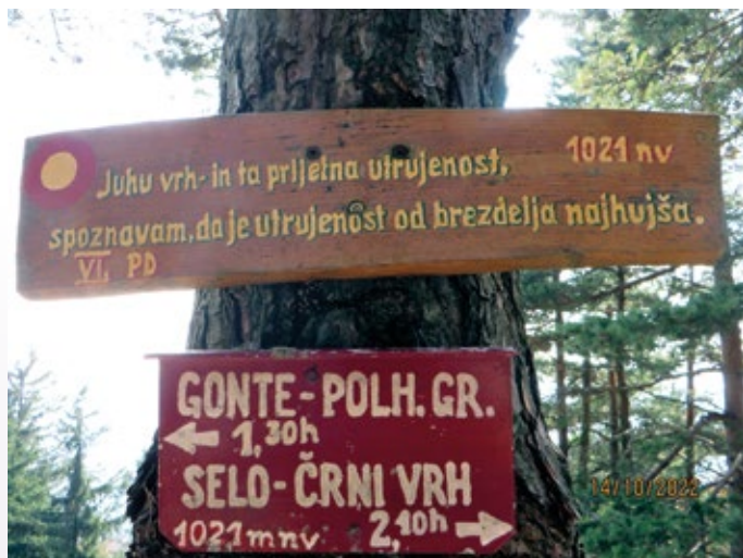
Zanimiva dobrodošlica na vrhu Tošča v Polhograjskem hribovju (1021 m)