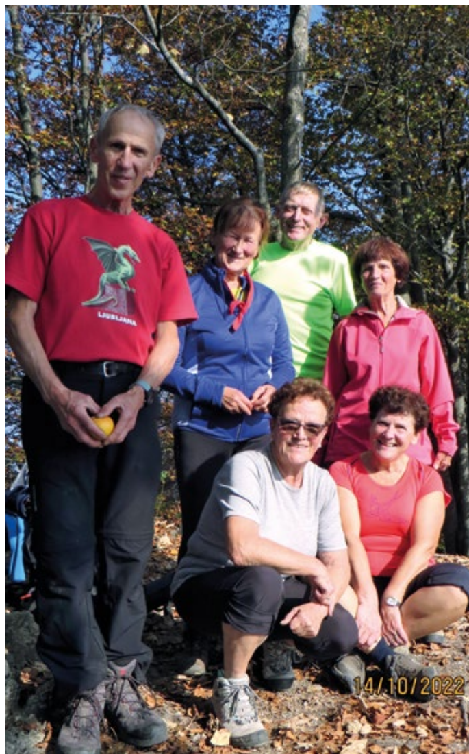
Zadovoljni pohodniki od Šentvida do Škofje Loke na vrhu Tošča

ki se nahaja na vrhu slemena, smo se ponovno dvignili za skoraj 200 višinskih metrov. Pri cerkvi smo vendarle zagledali končni cilj Škofjo Loko, a do nje je bilo še daleč. Na vso srečo je pot vodila večinoma navzdol in kljub dokaj hitremu spustu do Puštala nas je že začela priganjati poznata ura in prav podvizati smo se morali, da smo še ob dnevu prišli na avtobusno postajo v Škofji Loki. Naredili smo kratek posvet za izbor najugodnejše variante za vrnitev domov. Sledila je vožnja do železniške postaje, vožnja z vlakom do Vižmarij in primestni avtobus do Vodice. Celotni pohod je bil prijeten in hkrati naporen, ki nam ga je kljub ne več rosnim letom uspelo prehoditi. Zanimiva izkušnja, ki jo priporočam vsem z nekaj kondicije za vsaj 8 do 9 ur hoje. Glede na pridobljeno izkušnjo se bomo še lahko lotili tudi zahtevnejših pohodov. Mogoče se nam kdo od bralcev tudi priključi. Vabljeni v našo družbo.