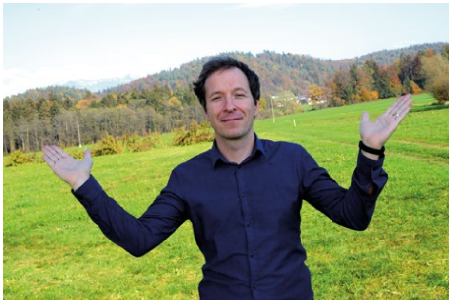
Ravnotežje v življenju!

Športniki se testiranju ne upirajo. Protidopinška testiranja jemljejo zelo resno in kot sestavni del profesionalnega športa. Nekateri odprto povedo, da so veseli, da jih obiščeemo, ker to pomeni, da se v njihovem športu izvaja testiranje – ne samo njih, ampak tudi njihovih konkurentov – kar je osnova za čisti šport. Po drugi strani pa večje število dopinških testov tudi korelira z uspešnostjo športnika. Športniki najvišjega ranga imajo tudi največ kontrol, npr. vrhunski profesionalni kolesar ima lahko na leto tudi do 100 dopiških kontrol – včasih celo večkrat dnevno, kot npr. na Dirki po Franciji, kjer se včasih kolesarja testira zjutraj, pol ure do eno uro pred štartom etape in po prihodu skozi cilj. Na drugi strani pa imamo športnike v nekaterih športih, kjer so lahko testirani npr. samo trikrat na leto, čeprav tekmujejo na največjih tekmovanjih (olimpij-